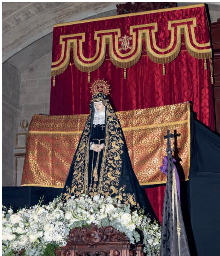
La Stma. Virgen de la Soledad tras ser coronada, luce en su "mesa" procesional.

Igualmente, al finalizar dicho Quinario le fue impuesta a la Santísima Virgen de la Soledad, la Medalla de Oro